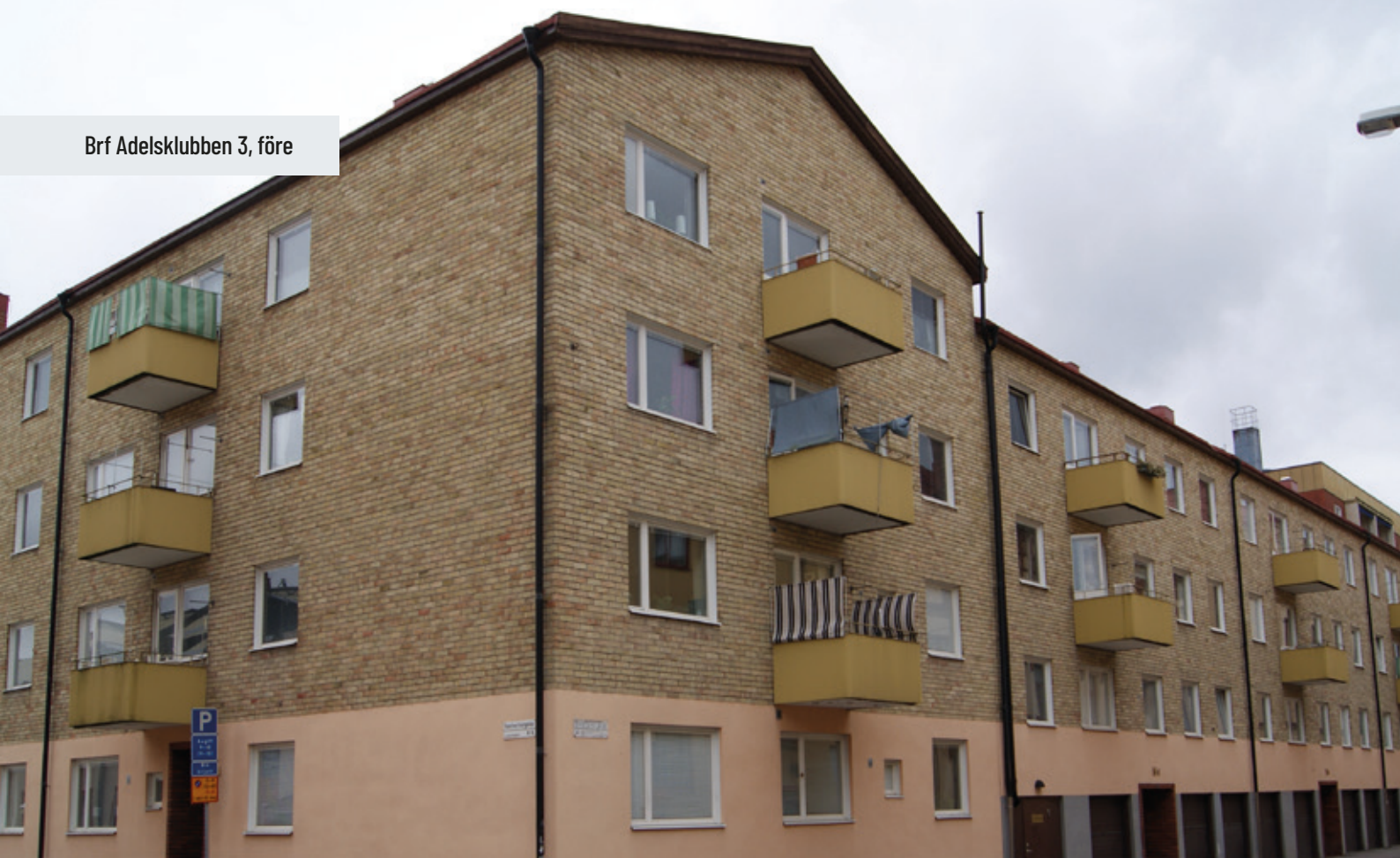
Brf Adelsklubben 3, före

Balkongsystem: Design/Vision med sinusplåt Infästning: Pelare på vägg Tillval: Matta & rullgardiner